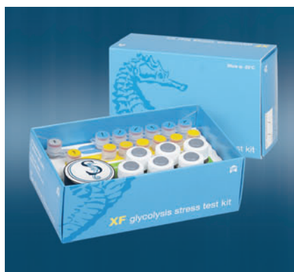
Тест-набор XF Glycolysis Stress