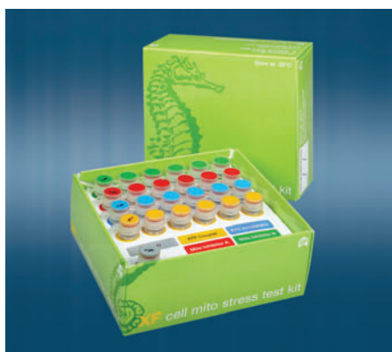
Тест-набор XF Cell Mito Stress

XF-стресс тест-наборы и реагенты – необходимый компонент стандартизированного анализа на XF e . Предварительно откалиброванные реагенты гарантированного качества и стандартные протоколы обеспечивают надежные и воспроизводимые результаты – от образца к образцу или от пациента к пациенту, позволяя, таким образом, выявлять и сравнивать различия в метаболизме, являющиеся основой изменений энергетики клетки при стрессе или заболеваниях.