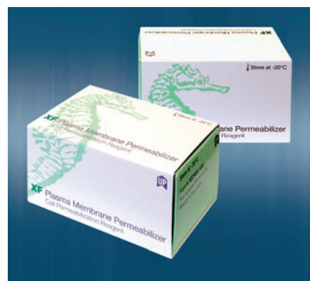
Реагент Cell Permeabilization